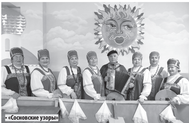
• «Сосновские узоры»