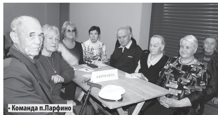
• Команда п.Парфино